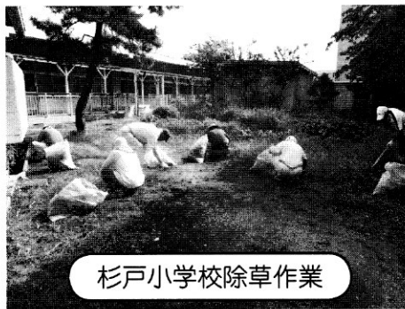
杉戸小学校除草作業