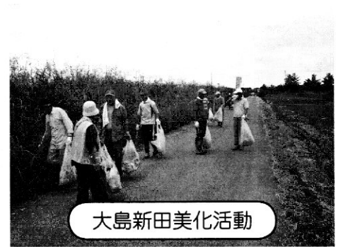
大島新田美化活動

11月3日（火）祝日 杉戸町産業祭に出店します！！ アグリパークにみなさんお越し下さい。