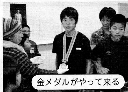
金メダルがやって来る

18日前後にすぎスポ祭交流大会が行われ種目は、グラウンドゴルフ・ターゲットバードゴルフ・硬式テニス・フットサルです。すぎスポ祭を機会に、近隣住民と交流を深める事が出来ました。