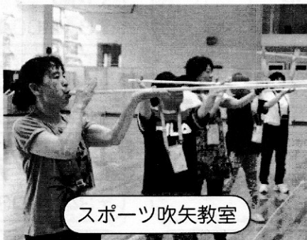
スポーツ吹矢教室