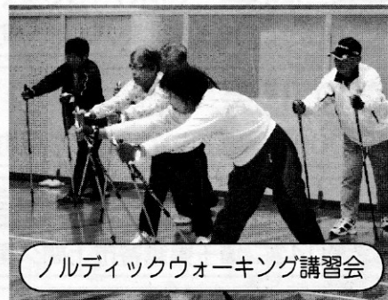
ノルディックウォーキング講習会