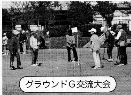
グラウンドG交流大会