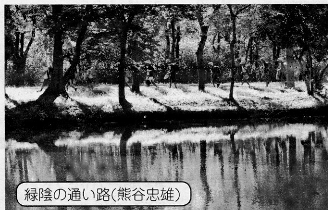
緑陰の通り路（熊谷忠雄）