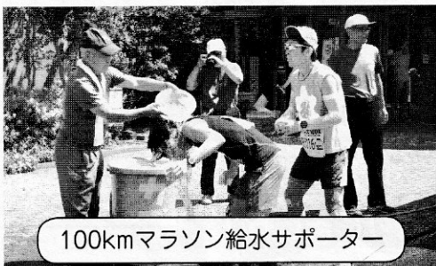
100kmマラソン給水サポーター

リタイアする結果でしたが、杉戸町の暖かい応援と元気をランナーに届けました。来年も応援して、行きたいです。