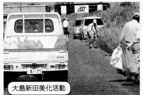
大島新田美化活動