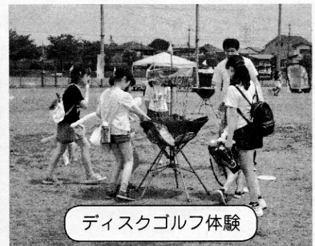
ディスクゴルフ体験