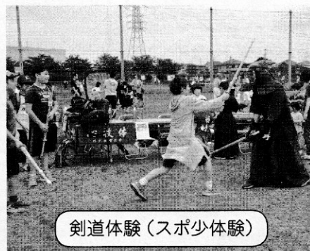
剣道体験(スポ少体験)