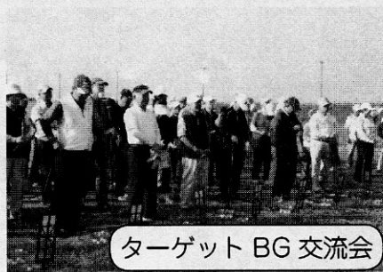
ターゲット BG 交流会