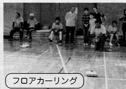
フロアカーリング