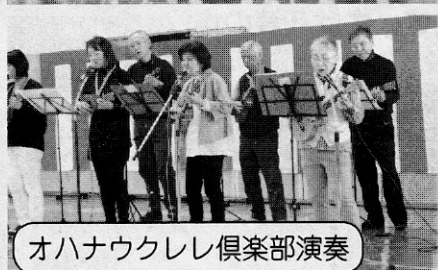
オハナウクレレ倶楽部演奏