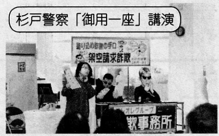
杉戸警察「御用一座」講演