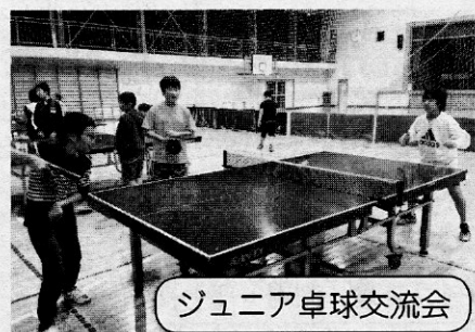
ジュニア卓球交流会