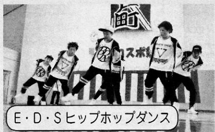
E・D・Sヒップホップダンス