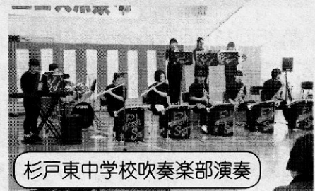
杉戸東中学校吹奏楽部演奏